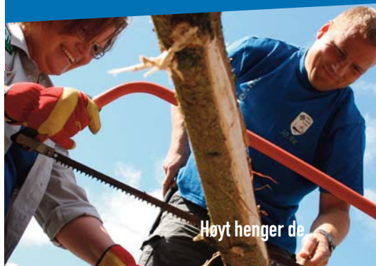
Høyt henger de